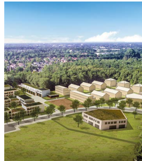
Am Fliegerhorst entsteht ein neues Wohnquartier.

Neues plant die GSG OLDENBURG an der Cloppenburger Straße. Nach einem Entwurf des Architekturbüros Selugga&Selugga Architektur GmbH entstehen auf 1.260 Quadratmetern ein Verbrauchermarkt und eine Bäckerei. Auf das Dach kommen vier Wohngebäude mit 41 Wohnungen. Auf den Freiflächen zwischen den Gebäuden sind Dachgärten und Spielplätze vorgesehen. Im ersten Ober-